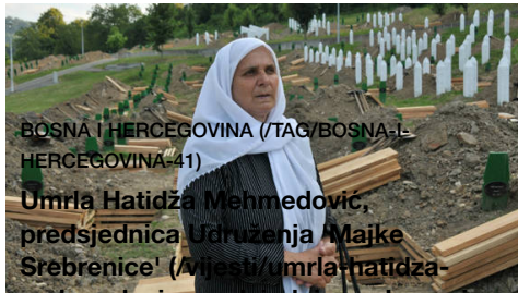
BOSNA I HERCEGOVINA (TAG/BOSNA-I-HERCEGOVINA-41)

(Mjesti/video-vratili-se-u-skolu-prije-izraelskih-buldozera)